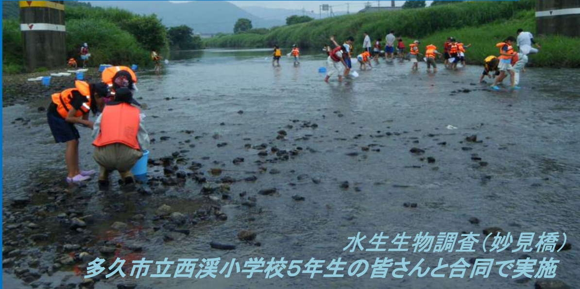
水生生物調査(妙見橋) 多久市立西溪小学校5年生の皆さんと合同で実施