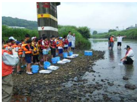
水生生物採取の様子

簡易検査キットを用いて水質を調べます。色見本を見ながら検査結果を判定している様子です。