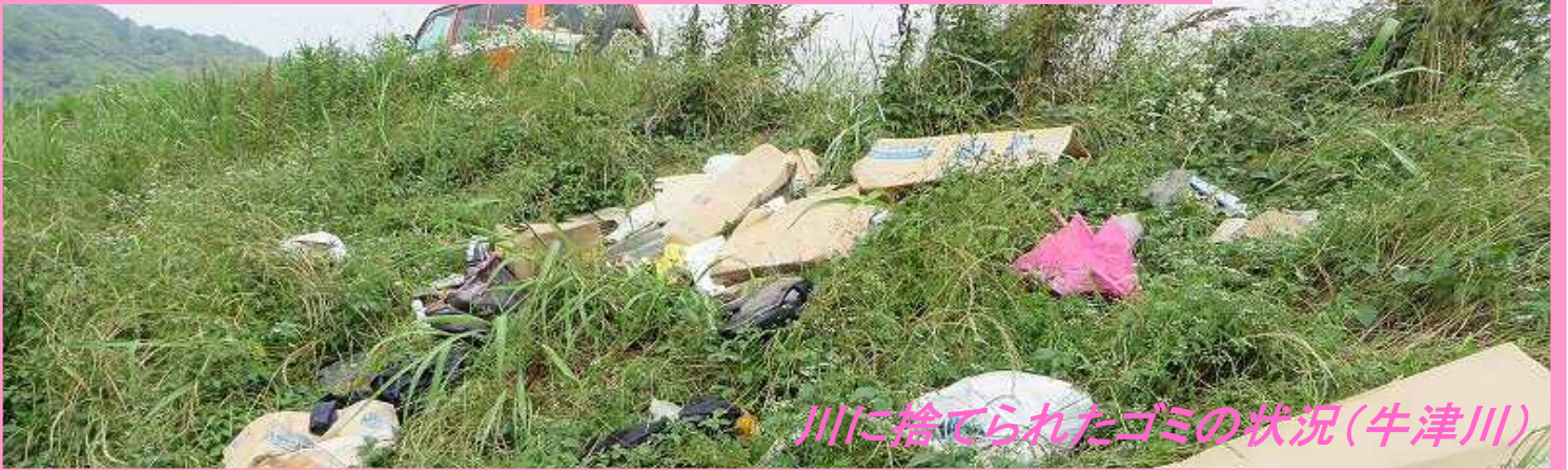
川に捨てられたゴミの状況(牛津川)