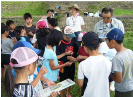
簡易水質測定の様子

簡易検査キットを用いて水質を調べます。色見本を見ながら検査結果を判定している様子です。