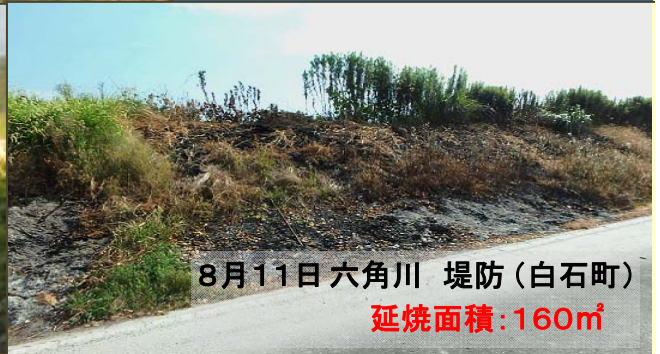
8月11日 六角川 堤防（白石町） 延焼面積：160㎡

武雄河川事務所が管理する六角川と松浦川で、 火災事故が 3週間で“4件”も発生 しました。今回は、消防署等の迅速な消火活動により幸いにも大事には至りませんでした。風向きや風の強さによっては、周辺の住宅等へ延焼し大きな被害となる恐れがあります。また、堤防周辺には、電話線等のライフラインが設置されていることもあり、私たちの生活に被害を与えるなどの二次災害にもつながります。これから空気も乾燥し、北風の季節になります。 河川敷や堤防ではゴミの焼却などは絶対に行わないで下さい。また、河川の近くでの「火の取扱い」には、十分注意してください！