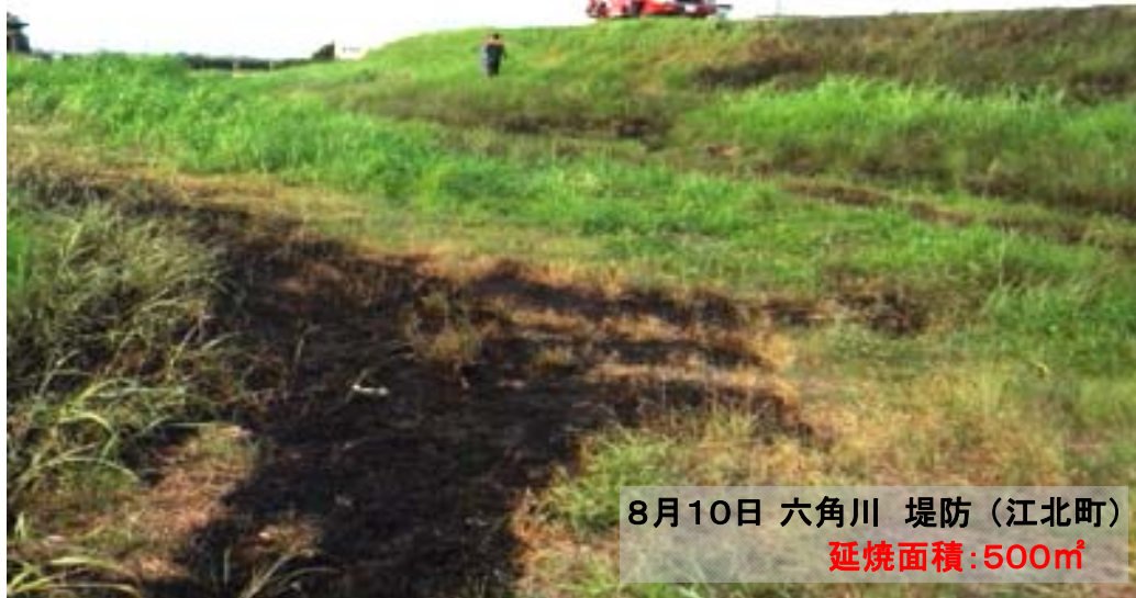
8月10日 六角川 堤防（江北町） 延焼面積：500㎡