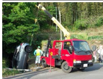
交通事故で車両から油流出