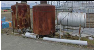
ビニールハウスのポリイタから油流出