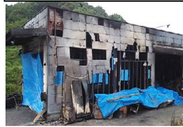
火災事故で店舗から油流出