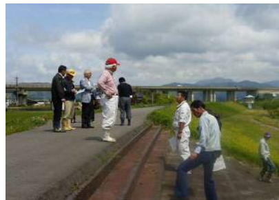
親水護岸・階段(武雄市 潮見)