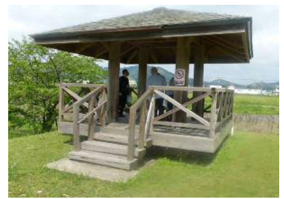
東屋(高橋自然観察園)