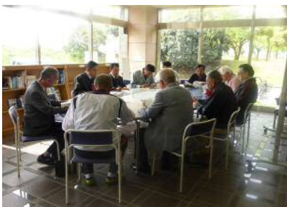
点検前に事故事例を確認

[参加者] 朝日出張所、杵藤土木事務所、武雄市、 武雄市パークゴルフ協会、橋町まちづくり推進協議会、橋公民館