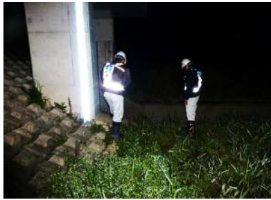
暗いなかでの概略点検 (スピード重視)

これから梅雨を迎えます。例年どおり今年も洪水時巡視訓練を行い、洪水に備えて準備をしています。