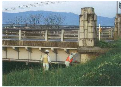
明るくなってから詳細点検 (ひび割れ、変形など異常の有無を調査)