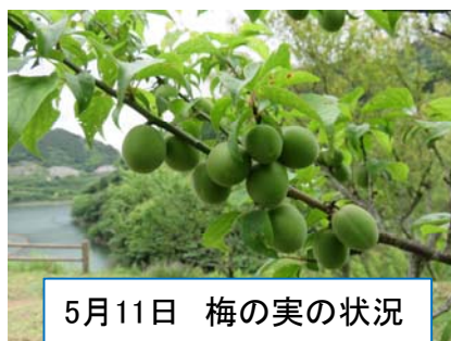
5月11日 梅の実の状況

連絡：巖木ダム管理支所 時間：平日8:30～17:15 TEL:0955-(63)-2500 FAX:0955-(63)-2512