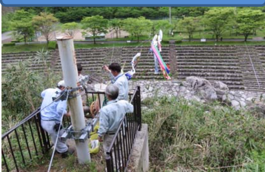
鯉のぼり設置作業状況