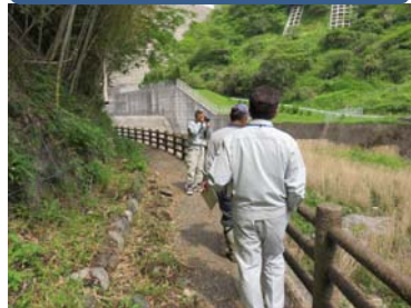
ダム周辺点検状況