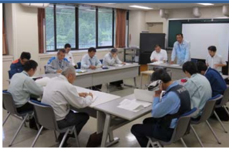
洪水時の情報伝達方法を確認