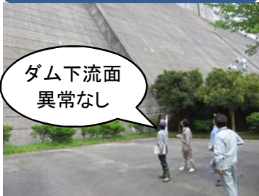
ダム下流点検状況