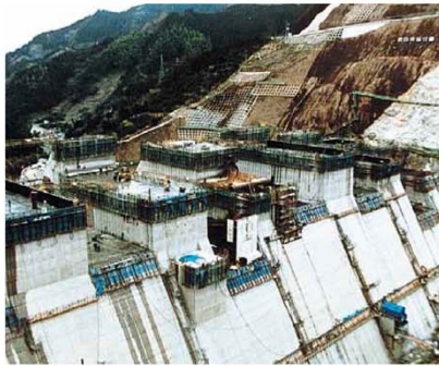
建設中のダム堤体(S60)