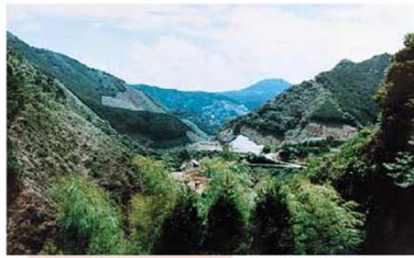
建設前の広瀬地区(S55)