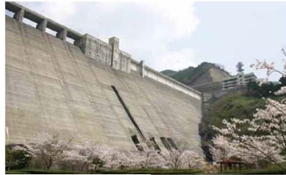
完成後の厳木ダム

厳木ダムは昭和62年度からダム下流を洪水から守り、暮らしに必要な水を確保し、天山ダム(九州電力)との揚水式発電の役割を果たしてきました。これからも、地域の安全・安心に寄与し、地域に親しまれるダムを目指してまいります。