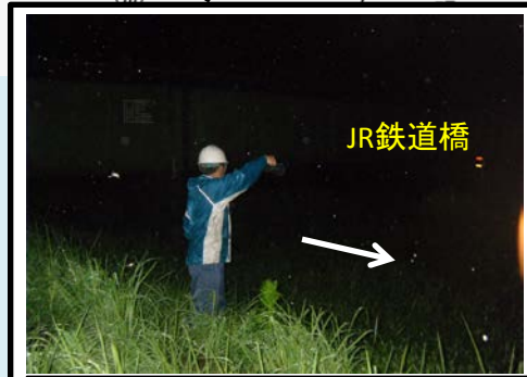
重要水防箇所は特に洪水の流れの状況を監視しています。