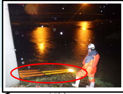
排水樋門の門柱に設置された水位危険度レベルを確認しています。