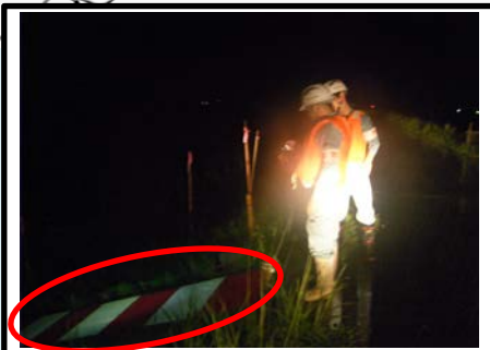
水位を確認し、堤防天端までの余裕を確認しています。(赤と白の高さの間隔は20cm)