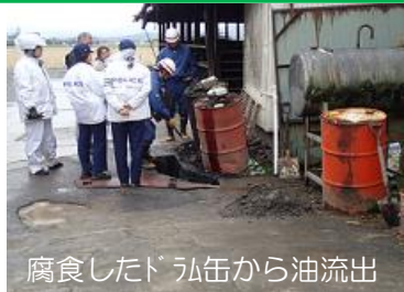
腐食したドラム缶から油流出