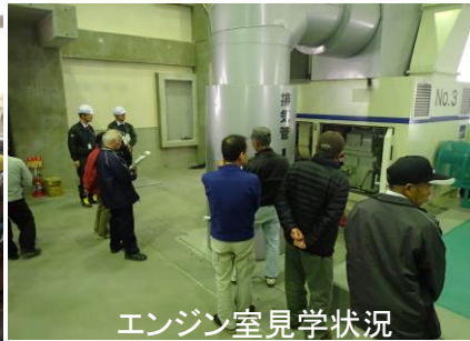
エンジン室見学状況