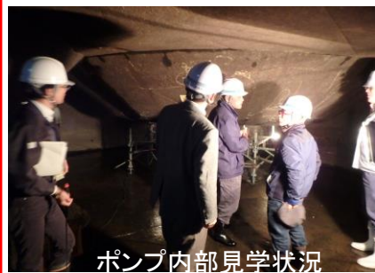
ポンプ内部見学状況