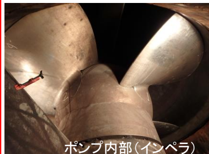
ポンプ内部(インペラ)