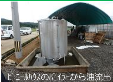
ビニールハウスのボイラーから油流出