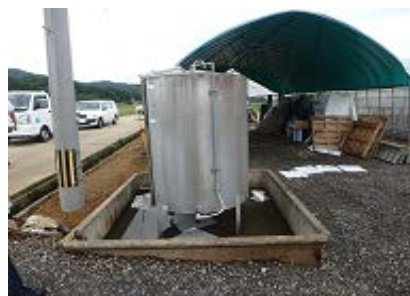
油の回収状況 (オイルフェンス・吸着マット設置)