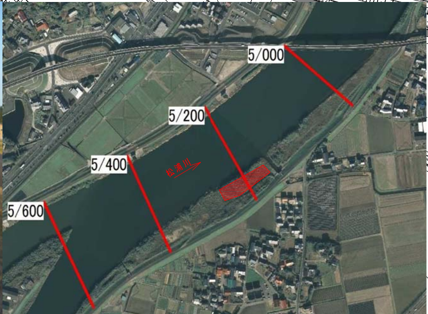
松浦川5k400付近から採取位置を望む