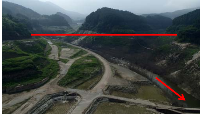
左:ダム右岸側より(—:平常時最高貯水位) 右上:嘉瀬川上流付近(ダム湖) しおいかわ 右下:神水川下流付近(ダム湖)