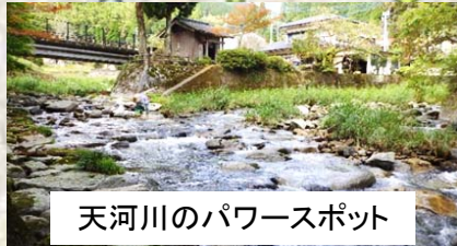
天河川のパワースポット

地元の人から「何してるの？」と不審者に思われたり、「番犬に追 いかけられたり」、「是非、裏の川を源流に指定してくれ！」と願 いされたり、庭掃除している年配の女性から「三瀬も過疎化が進ん でるんよね～若い人は都会に・・・」と延々お話をして頂いたり、ま た別荘をお持ちの方で川の側にお風呂を作り、優雅に楽しんでお られる方もおられたりと、新たな出会いが沢山ありました。