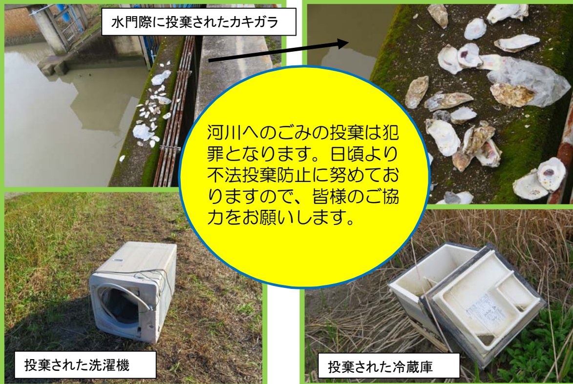
水門際に投棄されたカキガラ

河川へのごみの投棄は犯罪となります。日頃より不法投棄防止に努めておりますので、皆様のご協力をお願いします。