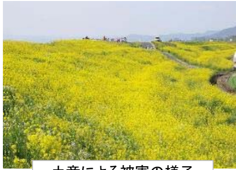
土竜による被害の様子