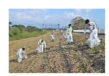
嘉瀬川安全協議会のボランティアによる清掃活動