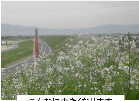
こんなに大きくなります