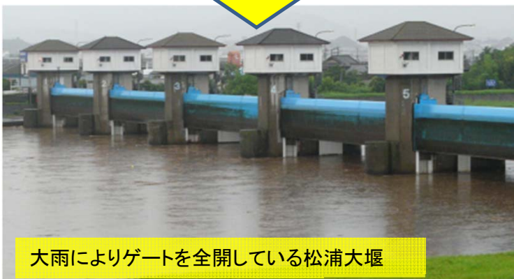
大雨によりゲートを全開している松浦大堰