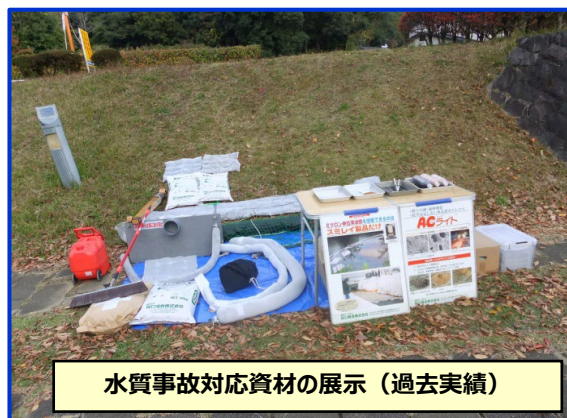
水質事故対応資材の展示 (過去実績)