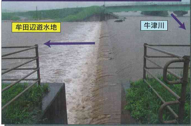
多久市南多久町牟田辺地区 牟田辺遊水地