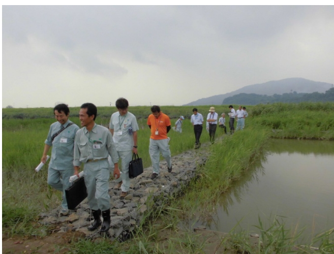
現地調査(牛津川ヨシ成長抑制試験箇所)