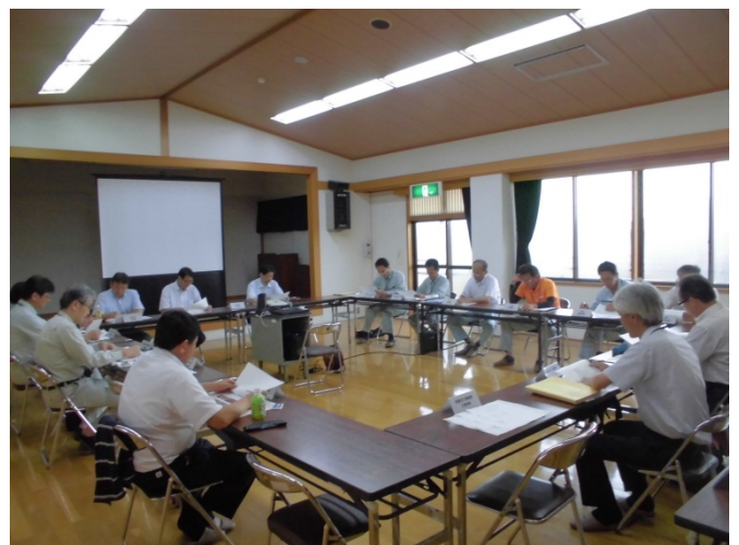
検討会(小城市牛津公民館)