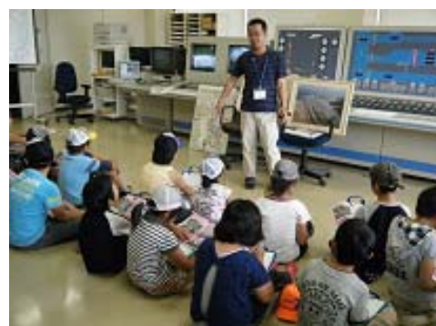
高橋排水機場(操作室)