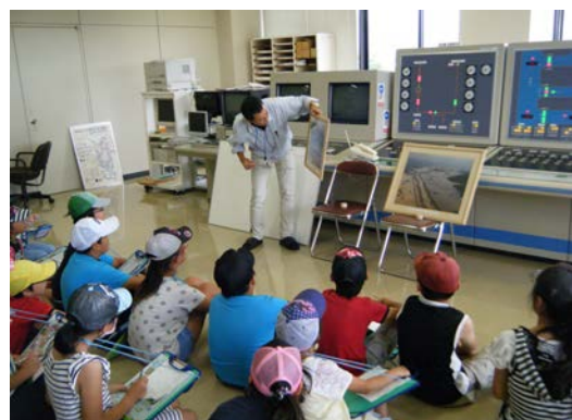
高橋排水機場(操作室)