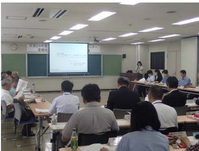
モニター会議（武雄河川事務所 会議室）