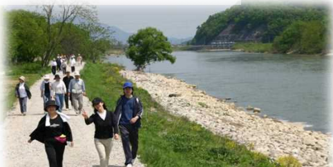
管理用通路をフットパスとして活用 (最上川/長井市)