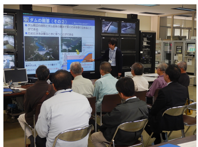
現地視察（松浦川水系 巖木ダム）