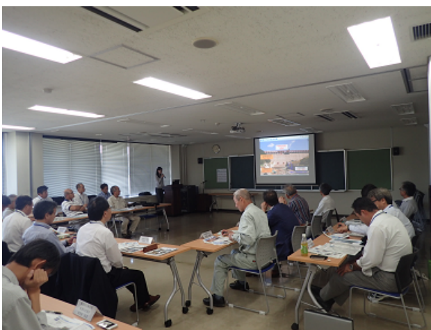
モニター会議（武雄河川事務所 会議室）