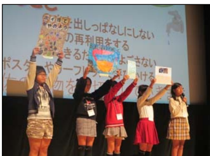
発表の様子(子どもの部)