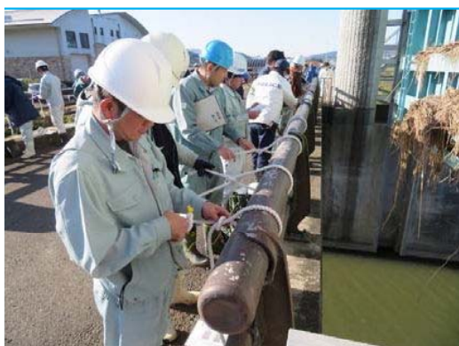
ロープの結び方訓練