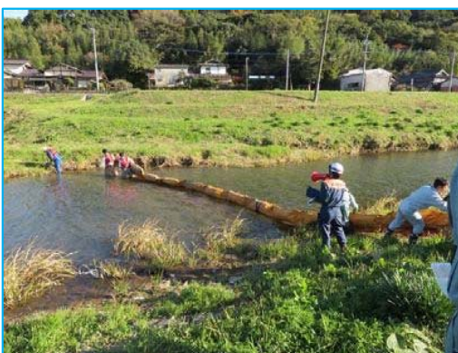
オイルフェンス設置訓練