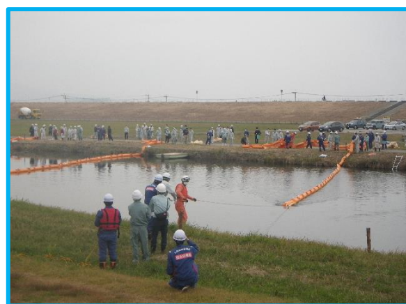
オイルフェンス設置訓練