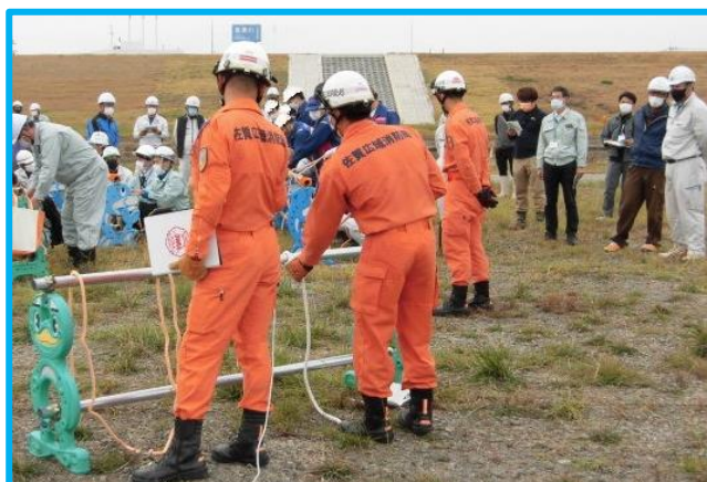
ロープの結び方訓練