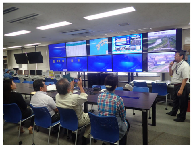
武雄河川事務所 防災情報室の見学会