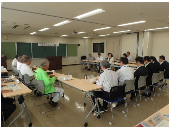
モニター会議（武雄河川事務所 会議室）