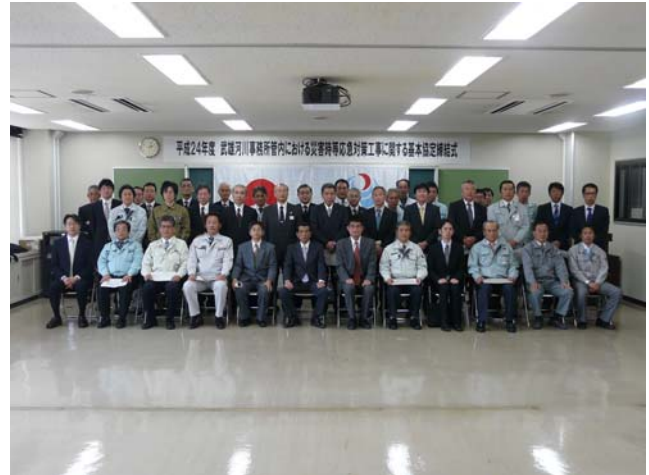
基本協定締結式の様子