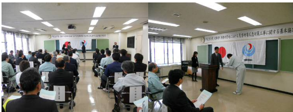
基本協定締結式の様子