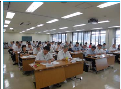
会場 事務所会議室