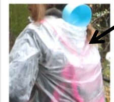
ひしゃく女子スタイル。 源流調査では人気です