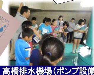
高橋排水機場(ポンプ設備)