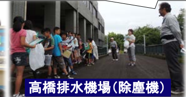
高橋排水機場(除塵機)