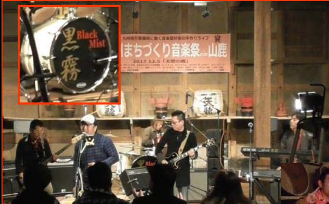
Black Mist 会場アンケート人気NO. 1