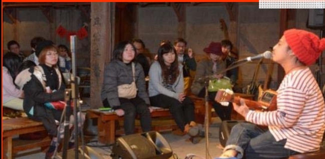
「chaobee」 聴かせてくれました なぜか「かなぶんや」さんのコメントが浮かぶ