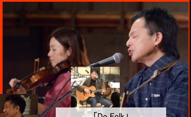
「Do Folk」 今年も注目は・・・