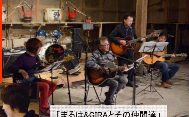
「まるは&GIRAとその仲間達」 真剣からコミックに