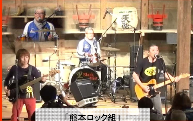
「熊本ロック組」 演奏もMCもさすがプロ