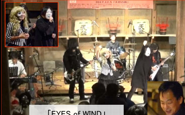
「EYES of WIND」 だれ!?