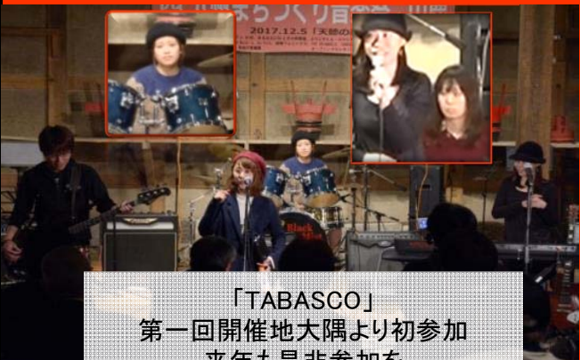
「TABASCO」 第一回開催地大隅より初参加 来年も是非参加を