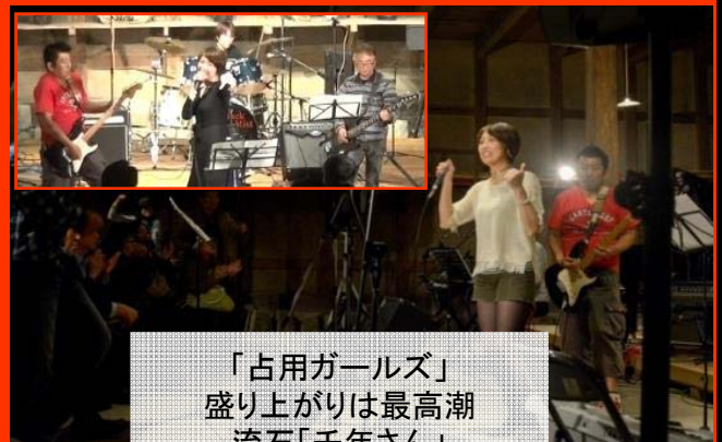
「占用ガールズ」 盛り上がりは最高潮 流石「千年さん」