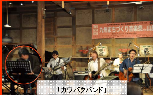
「カワバタバンド」 こちよいサウンド