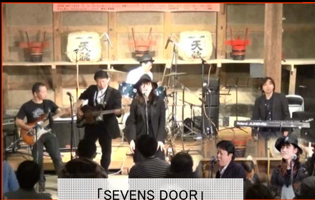
「SEVENS DOOR」 音楽祭初のサクセスも