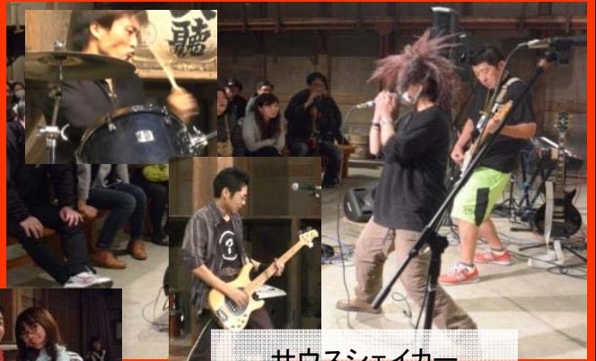
サウスシェイカー とにかく迫力満点 会場果然