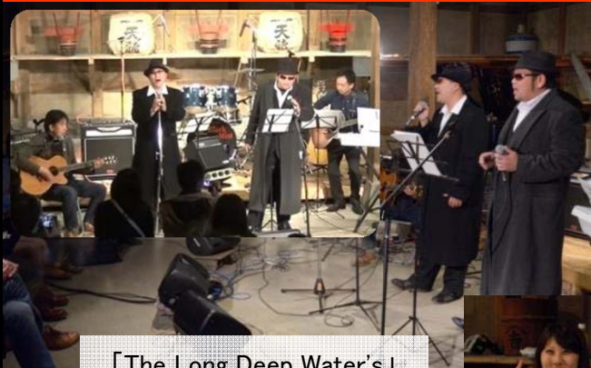
「The Long Deep Water's」 怖い人たち