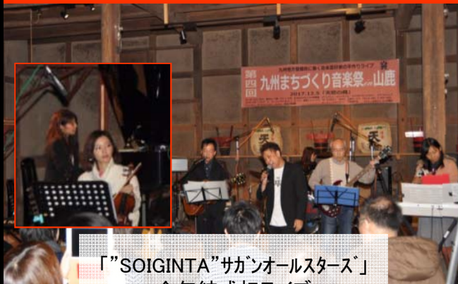
「"SOIGINTA"サガンオールスターズ」 今年結成初ライブ