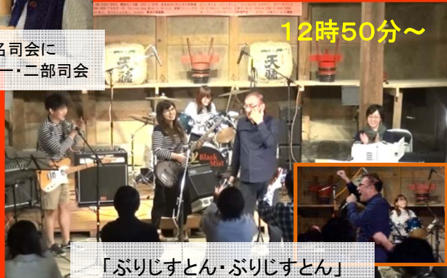
「ぶりじすとん・ぶりじすとん」 楽しさが表れていました