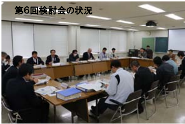
第6回検討会の状況

引き続き、検討会を通じて情報共有を図りながら、より流域が一体となって有明海の環境保全の取り組みを進めてまいります。