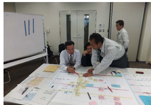
②台風接近に伴う事前行動項目を付せんに書き出し大判紙へ実施順に並べる