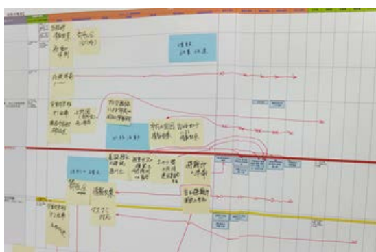
③書き出した行動項目を実施するために必要な他部からの情報や連携行動を追記