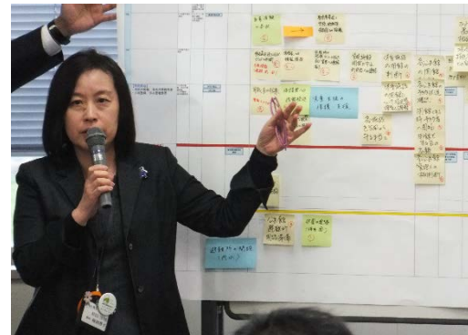
④各部が検討結果について発表し、情報を共有した