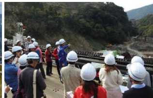
普段は入れないダムサイトにて。特別な記憶に残る現場体験