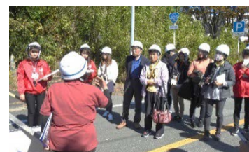
工事進捗状況も熊本復興事務所より解説