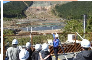
実際に被災を経験したガイド協会からの貴重な体験談