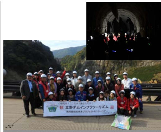
普段体験できない現場(トンネル内)潜入

→ モニターツアーを通じて磨いた観光のパーツを、今後の着地型観光商品開発の参考に活用