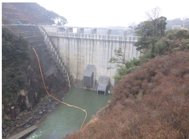
右岸からダム上流面を望む