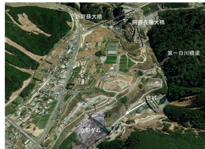
湛水範囲イメージ図