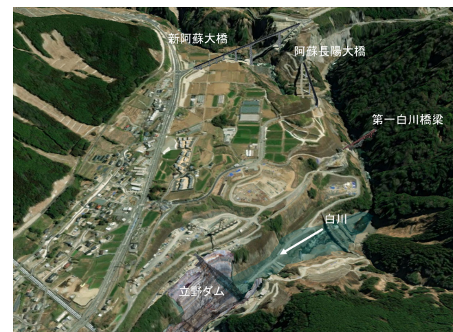
湛水範囲イメージ図