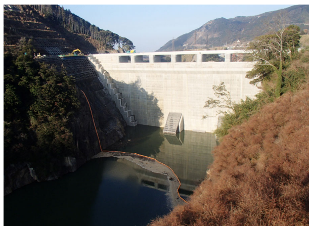
右岸からダム上流面を望む