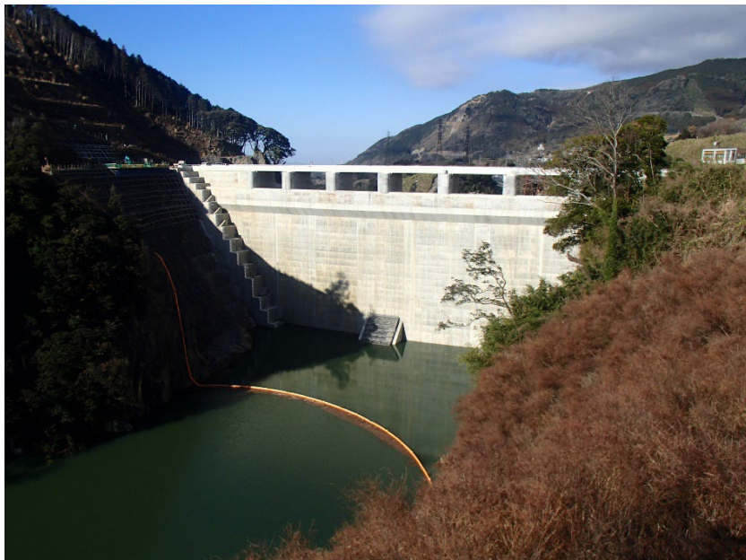
右岸からダム上流面を望む