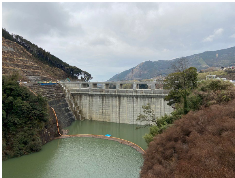
右岸からダム上流面を望む