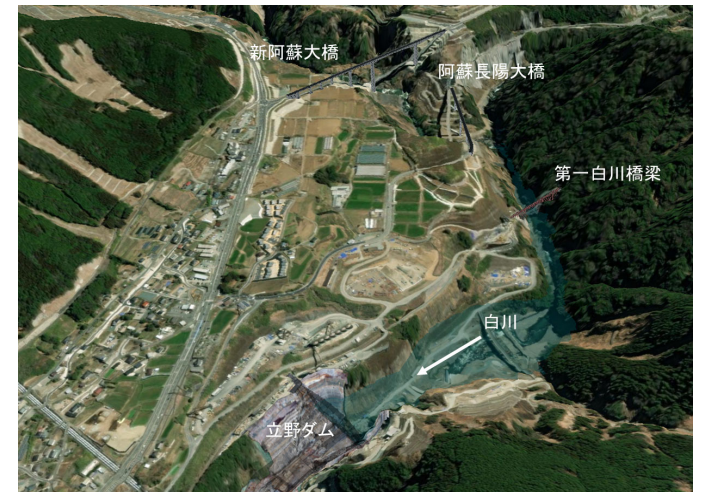
湛水範囲イメージ図