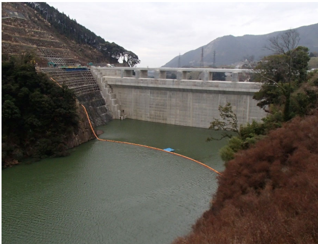
右岸からダム上流面を望む