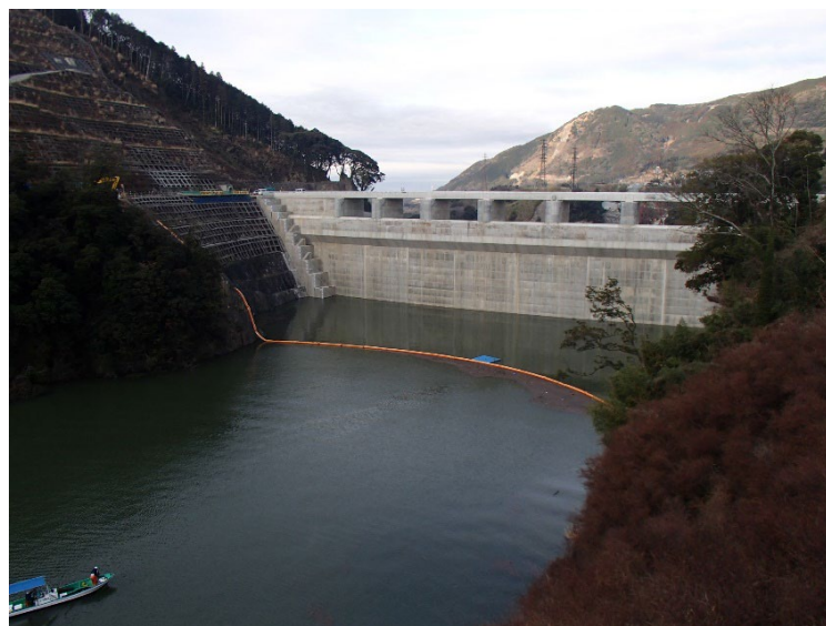
右岸からダム上流面を望む