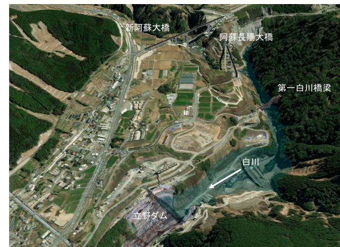
湛水範囲イメージ図