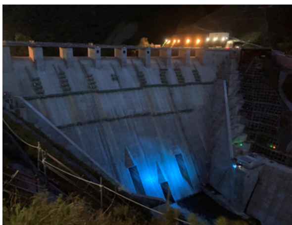
ライトアップのイメージ