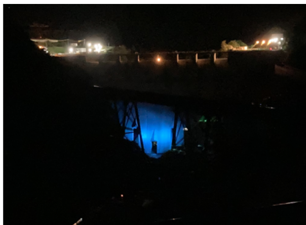
立野ダム展望台からの様子