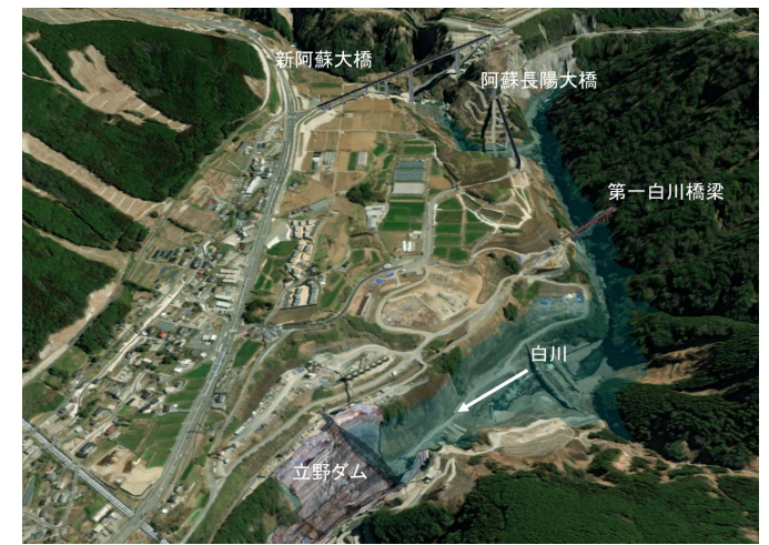
湛水範囲イメージ図