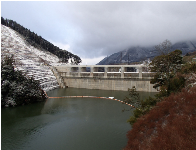
右岸からダム上流面を望む