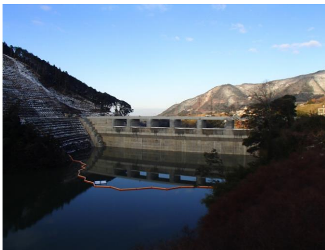
右岸からダム上流面を望む