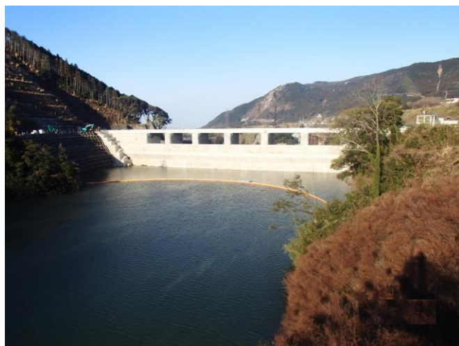
右岸からダム上流面を望む