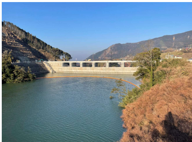
右岸からダム上流面を望む