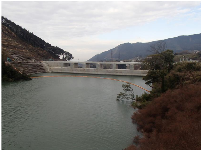
右岸からダム上流面を望む