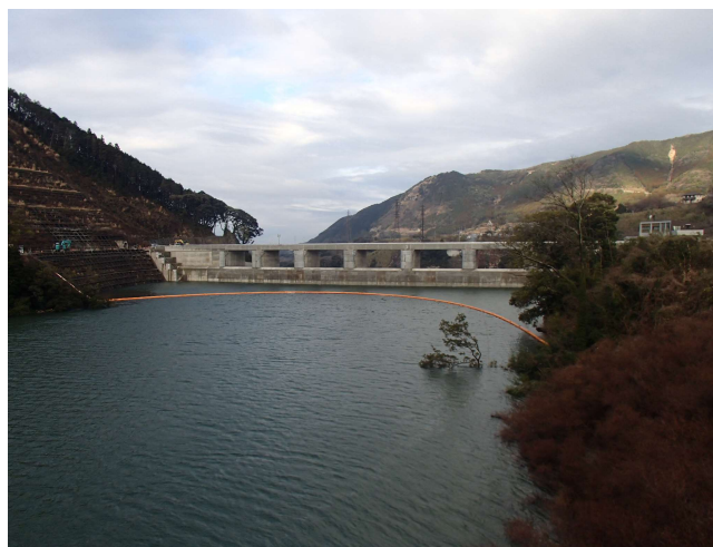
右岸からダム上流面を望む