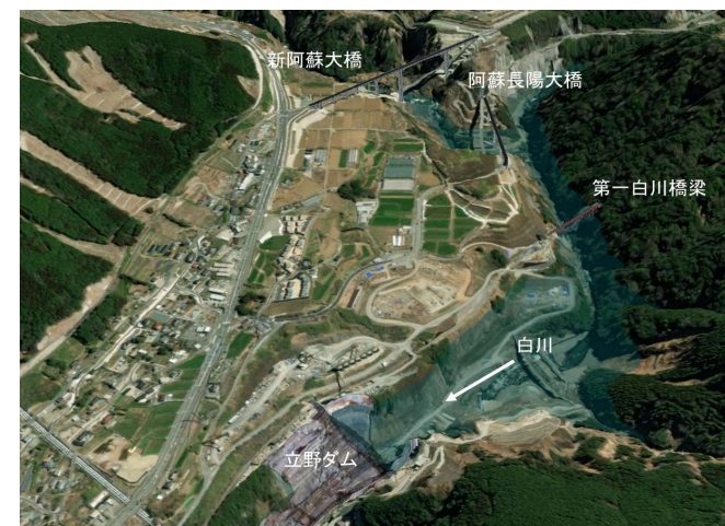
湛水範囲イメージ図